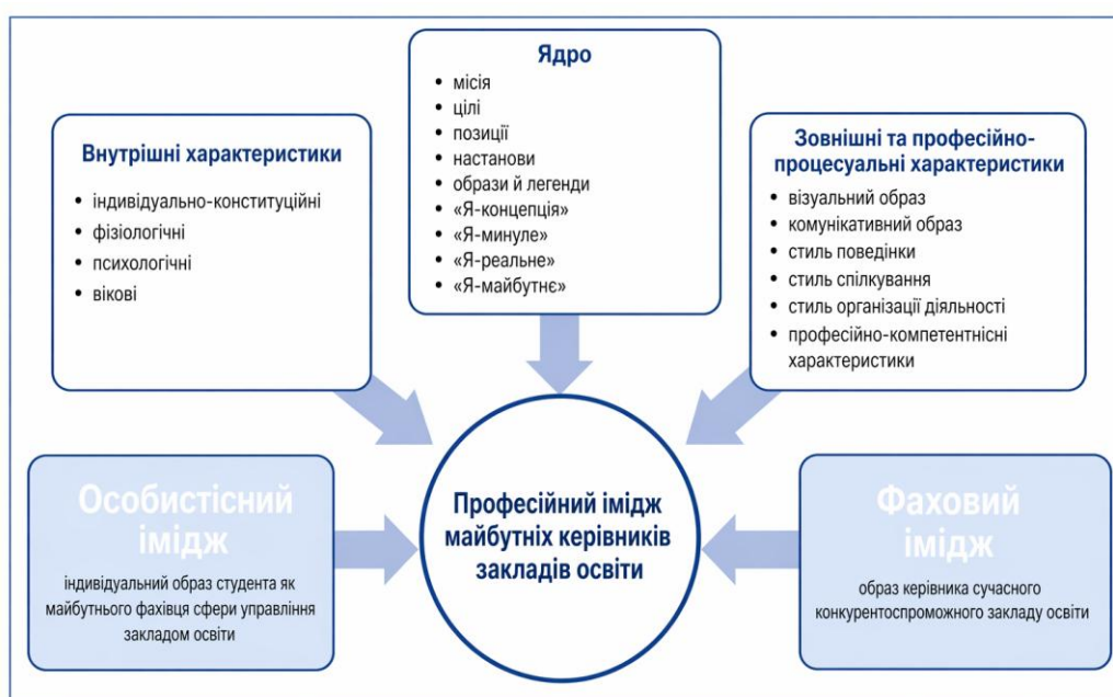
Рис. 1.1. Змістова структура професійного іміджу майбутніх керівників закладів освіти

та ін.) виокремлюють у ній наявність певного ядра (природного компонента), що уособлює сталі особистісні характеристики, які виявляються в будь-яких професійних і життєвих ситуаціях, а також внутрішній і зовнішній рівні репрезентації іміджу, що взаємно зумовлюють один одного [6, с. 34]. Ядро професійного іміджу фахівця становлять такі сформовані іміджові структури, як місія, цілі, позиції, настанови, образи й легенди, «Я-концепція», а також ієрархія розвитку іміджу в часі та професійному просторі: «Я-минуле», «Я-реальне» і «Я-майбутнє». До ядра прилягають структури, що об'єднують у собі індивідуально-конституційні (фізіологічні, психологічні, вікові), соціально-поведінкові (візуальний і комунікативний образи, стильові різновиди поведінки, спілкування й організації діяльності) та професійно-компетентнісні характеристики суб'єкта. Як наголошує О. Митцева, цілісність структури професійного іміджу забезпечується взаємопов'язаністю її складників, стійкість структури – ядром іміджу, а динамічність розвитку – зовнішнім складником іміджу [16, с. 9].