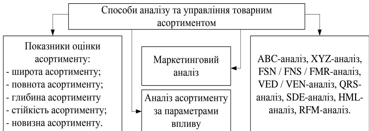
Рис. 1. Способи аналізу та управління товарним асортиментом

Наразі на практиці використовують кілька способів аналізу та управління товарним асортиментом (рис. 1.).