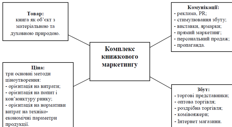
Рисунок 1 «Комплекс книжкового маркетингу»

Книги розглядаються як продукція, що має подвійну природу. З однієї сторони, це продукт, який створюється для інтелектуального розвитку людини та продукт духовного розвитку. Звертаючи увагу на це, можна дійти висновку, що впливаючи на духовну сферу, книга також впливає й на нашу реальність, спонукаючи змінюватись самим та змінювати навколишній світ (владу, культуру, економіку), тобто можна сказати, що книга залишається головною ідейною зброєю в руках людини. З іншої сторони, книга це товар, що створює власний ринок, тобто ринок книжкової продукції.