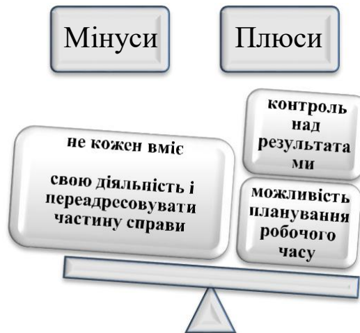
Рис. 4. Плюси та мінуси застосування принципів тайм-менеджменту. При реалізації технології тайм-менеджменту враховується, що особиста працездатність студентів складається з внутрішніх факторів (правильне харчування, виконання фізичних вправ, активний відпочинок, профілактика шкідливих звичок, раціональна організація праці та відпочинку, загартовування, правильне дихання, організація сну) і зовнішніх факторів (правильна організація навчальної діяльності, використання профілактики психоемоційного напруження, вплив екології: води, повітря, шуму та інші.)

Модель технології тайм-менеджменту у розвитку професійно-ціннісних інтенцій майбутніх учителів музичного мистецтва у закладі вищої мистецької освіти відображає закономірності (структура і рівень самоосвітньої діяльності детерміновані розвитком індивідуального досвіду самостійної діяльності в процесі ускладнення вирішуваних пізнавальних і творчих завдань); принципи (моделювання, особистісної орієнтованості, функціональності, ситуативності, новизни, позитивності); зміст (освітній процес здійснюється в напрямку залучення майбутніх вчителів музичного мистецтва до цінностей самоосвітньої діяльності, прийняття принципів самоорганізації в досягненні самоосвіти, оволодіння педагогічною технологією тайм-менеджменту при самостійному пошуку та аналізі інформації); методи тайм-менеджменту (планування свого навчального часу; розвиток професійно-ціннісних інтенцій;