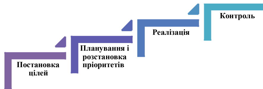
Рис. 3. Етапи виконання планів згідно тайм-менеджменту

Необхідно вміти чітко відповідати планам. Їх виконання, засноване на принципах тайм-менеджменту, відбувається в чотири етапи: