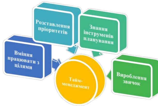
Рис. 2. Принципи тайм-менеджменту

Необхідно вміти чітко відповідати планам. Їх виконання, засноване на принципах тайм-менеджменту, відбувається в чотири етапи: